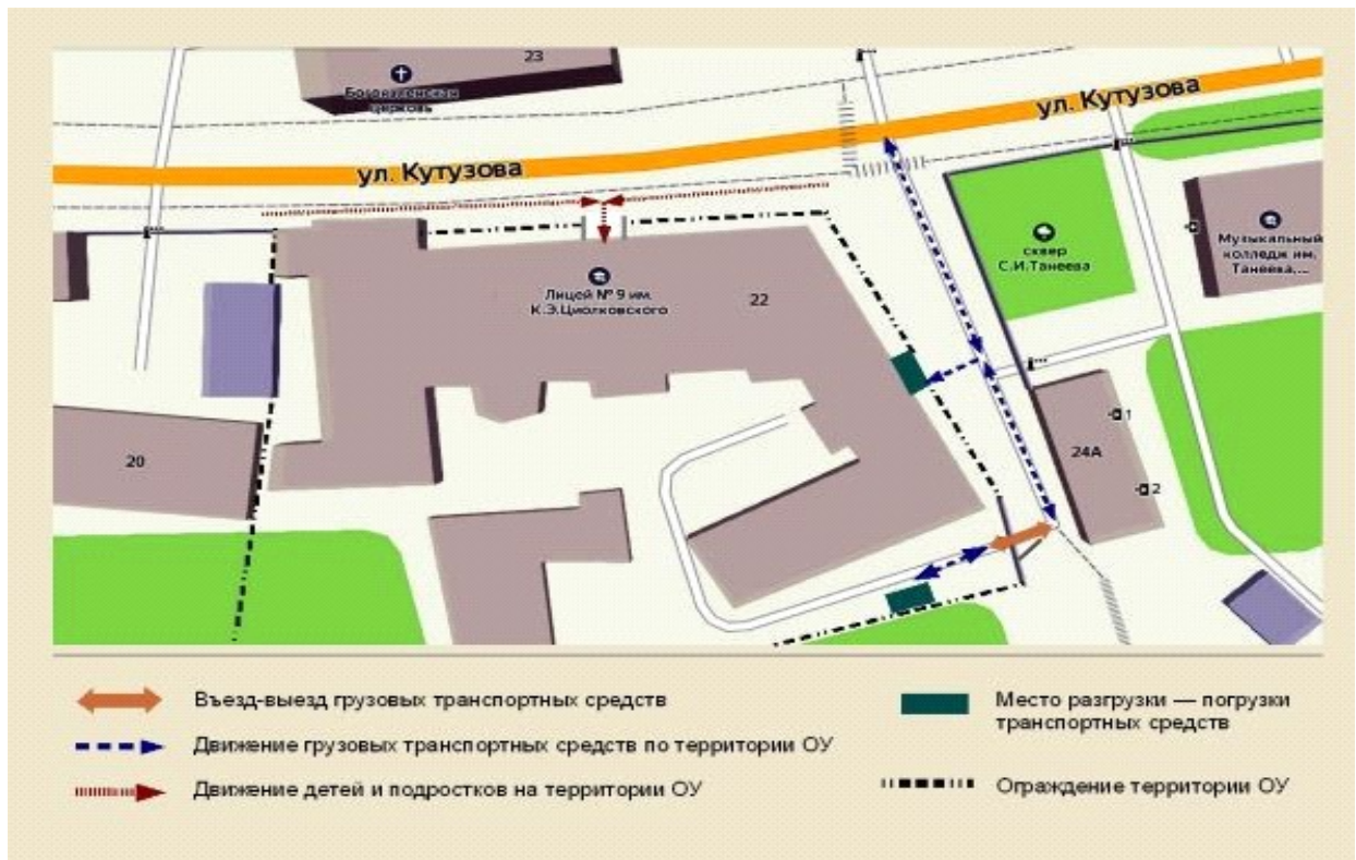
Схема движения транспортных средств по территории ОУ

Время разгрузки/погрузки транспорта на территории ОУ - 07 час. 00 мин.